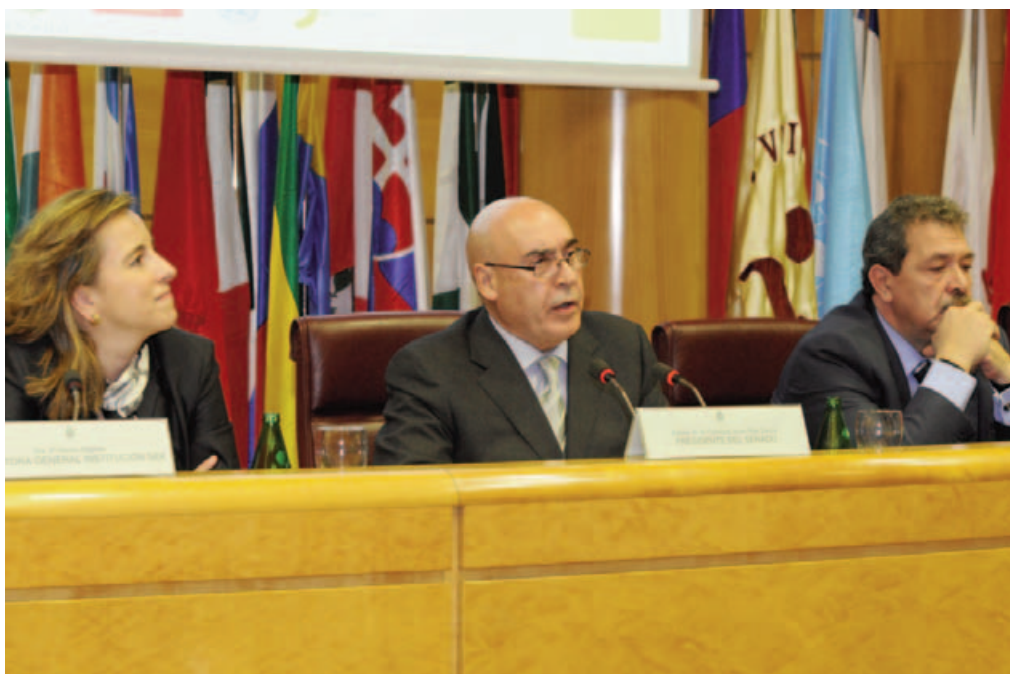
IV Encuentro SEKMUN. D. Javier Rojo, presidente del Senado, se dirige a los participantes.

Podrán participar de la Asamblea General como miembros de la misma todos los Estados Miembros de las Naciones Unidas y ONG que decide el comité organizador de SEKMUN.